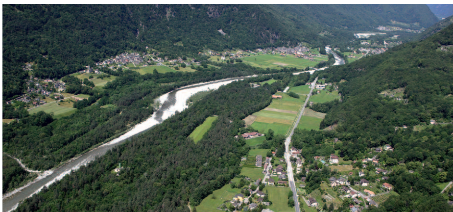
La nouvelle Commune de Maggia est née le 5 avril 2004 avec le rattachement des communes Aurigeno, Coglio, Giumaglio, Lodano, Maggia, Moghegno et Someo.

Pour vérifier les effets des fusions, on a analysé l'évolution de la dépense de fonctionnement de 7 nouvelles communes tessinoises qui ont été constituées en 2004, en fusionnant 42 communes préexistantes. Il s'agit de communes de différente taille situées aussi bien dans